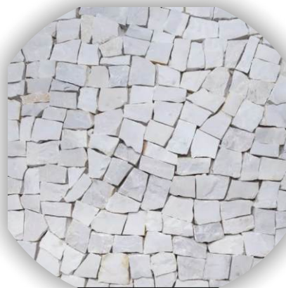
Material natural sujeito alteração de cor

A Pedra Portuguesa também conhecida como mosaico português ou petipavê, possui formato irregular, que podem ser usadas para formar padrões decorativos ou mosaicos pelo contraste entre as pedras de distintas cores, formas, proporcionando uma grande versatilidade.