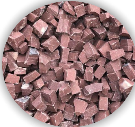
Material natural sujeito alteração de cor

A Pedra Portuguesa também conhecida como mosaico português ou petipavê, possui formato irregular, que podem ser usadas para formar padrões decorativos ou mosaicos pelo contraste entre as pedras de distintas cores, formas, proporcionando uma grande versatilidade.