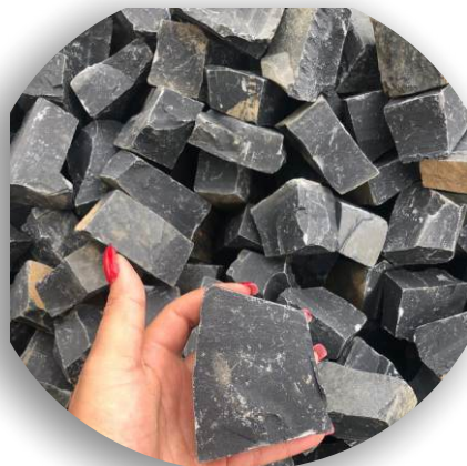
Material natural sujeito alteração de cor

A Pedra Portuguesa também conhecida como mosaico português ou petipavê, possui formato irregular, que podem ser usadas para formar padrões decorativos ou mosaicos pelo contraste entre as pedras de distintas cores, formas, proporcionando uma grande versatilidade.