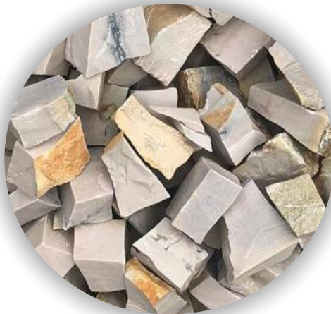
Material natural sujeito alteração de cor

A Pedra Portuguesa também conhecida como mosaico português ou petipavê, possui formato irregular, que podem ser usadas para formar padrões decorativos ou mosaicos pelo contraste entre as pedras de distintas cores, formas, proporcionando uma grande versatilidade.