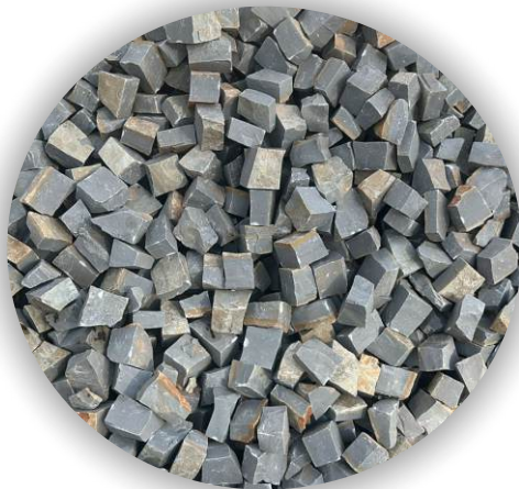
Material natural sujeito alteração de cor

A Pedra Portuguesa também conhecida como mosaico português ou petipavê, possui formato irregular, que podem ser usadas para formar padrões decorativos ou mosaicos pelo contraste entre as pedras de distintas cores, formas, proporcionando uma grande versatilidade.